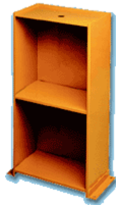
MS mobiletto di supporto support cabinet