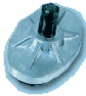
PA piatto appoggio supporting plate